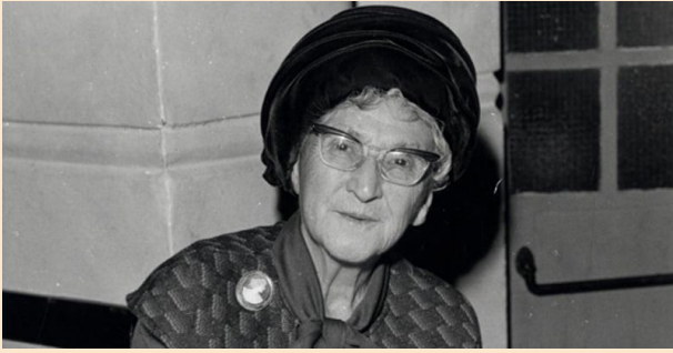
Figura 4. Irene Barclay (1894-1989)