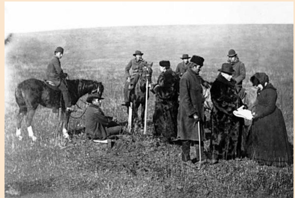
Figura 3. Alice Fletcher tiene in mano il fondo di un documento che assegna una porzione di terra ai Nasi Forati.

Nel 1884, aveva assegnato a 1.194 persone di Omaha, circa 30.732 ettari di terreni suddivisi in 954 lotti. Questo progetto ha riconosciuto la Fletcher come la prima geometra donna americana .