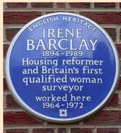
Figura 5. Targa blu dell'English Heritage in onore di Irene Barclay

In un necrologio per The Guardian dopo la sua morte nel 1989, Irene è stata descritta come " una delle più influenti riformatrici sociali degli anni 20 esimo secolo ".